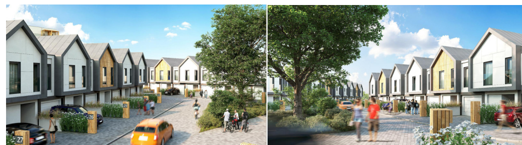
Informacja na karcie nie stanowi oferty handlowej w rozumieniu art. 66 kodeksu cywilnego.

MWM MWM ARCHITEKCI SP. Z O.O. UL. PARTYZANTÓW 1A 35-242 RZESZÓW